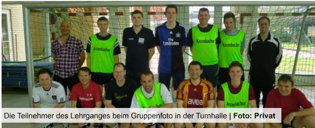
Die Teilnehmer des Lehrganges beim Gruppenfoto in der Turnhalle

Münster. Vom 15. bis 17. April 2011 trafen sich die Spitzen- und Teamschiedsrichter des Kreises Münster/ Warendorf im SportCentrum Kamen-Kaiserau zur alljährlichen Vorbereitung auf die Verbandsprüfung.