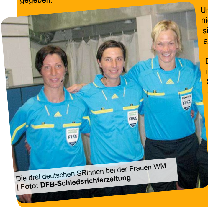
Die drei deutschen SRinnen bei der Frauen WM

Der Fußballweltverband FIFA hat Mitte April das Aufgebot der Schiedsrichterinnen und Assistentinnen für die Frauen-Weltmeisterschaft 2011 in Deutschland bekannt gegeben.