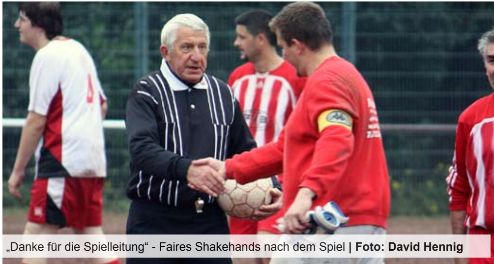
„Danke für die Spielleitung“ - Faires Shakehands nach dem Spiel